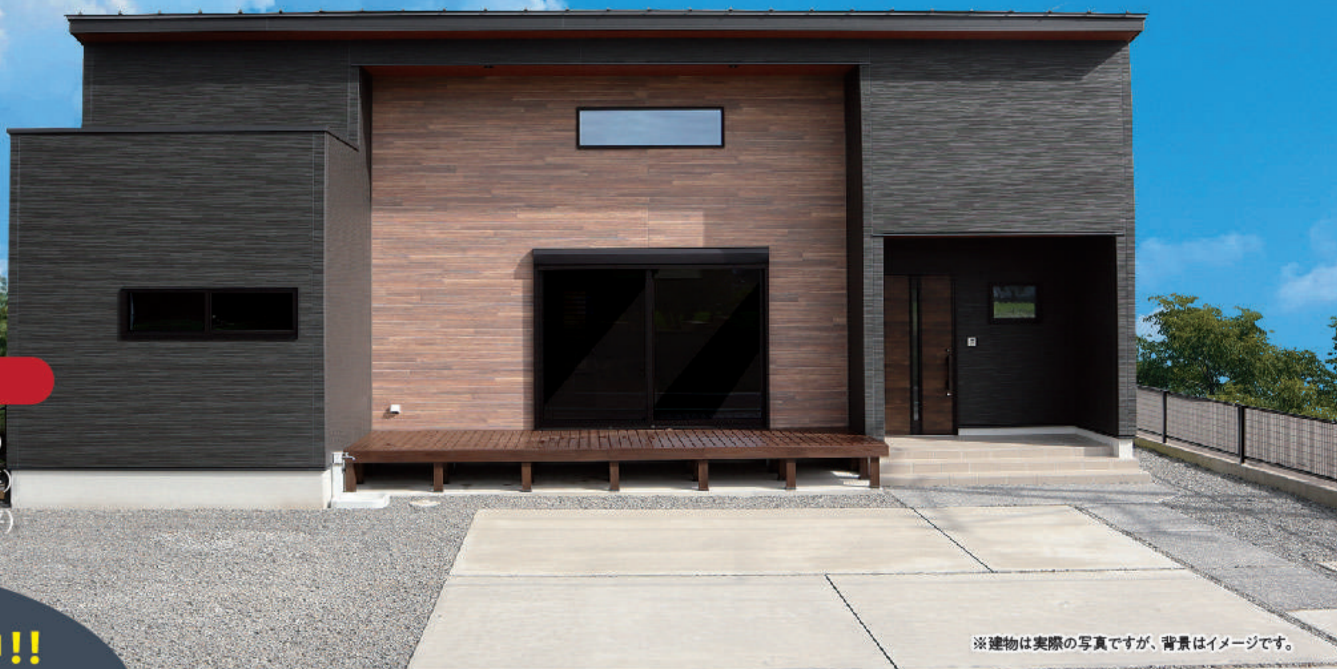
※建物は実際の写真ですが、背景はイメージです。

延床面積: 94.40㎡ (28.55坪) 建築面積: 103.20㎡ (31.21坪) 敷地面積: 252.62㎡ (76.42坪)