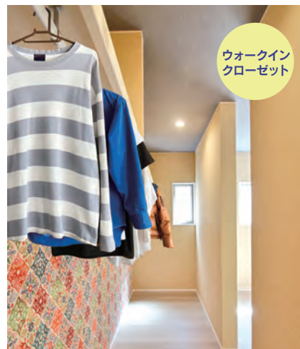
ウォークイン クローゼット